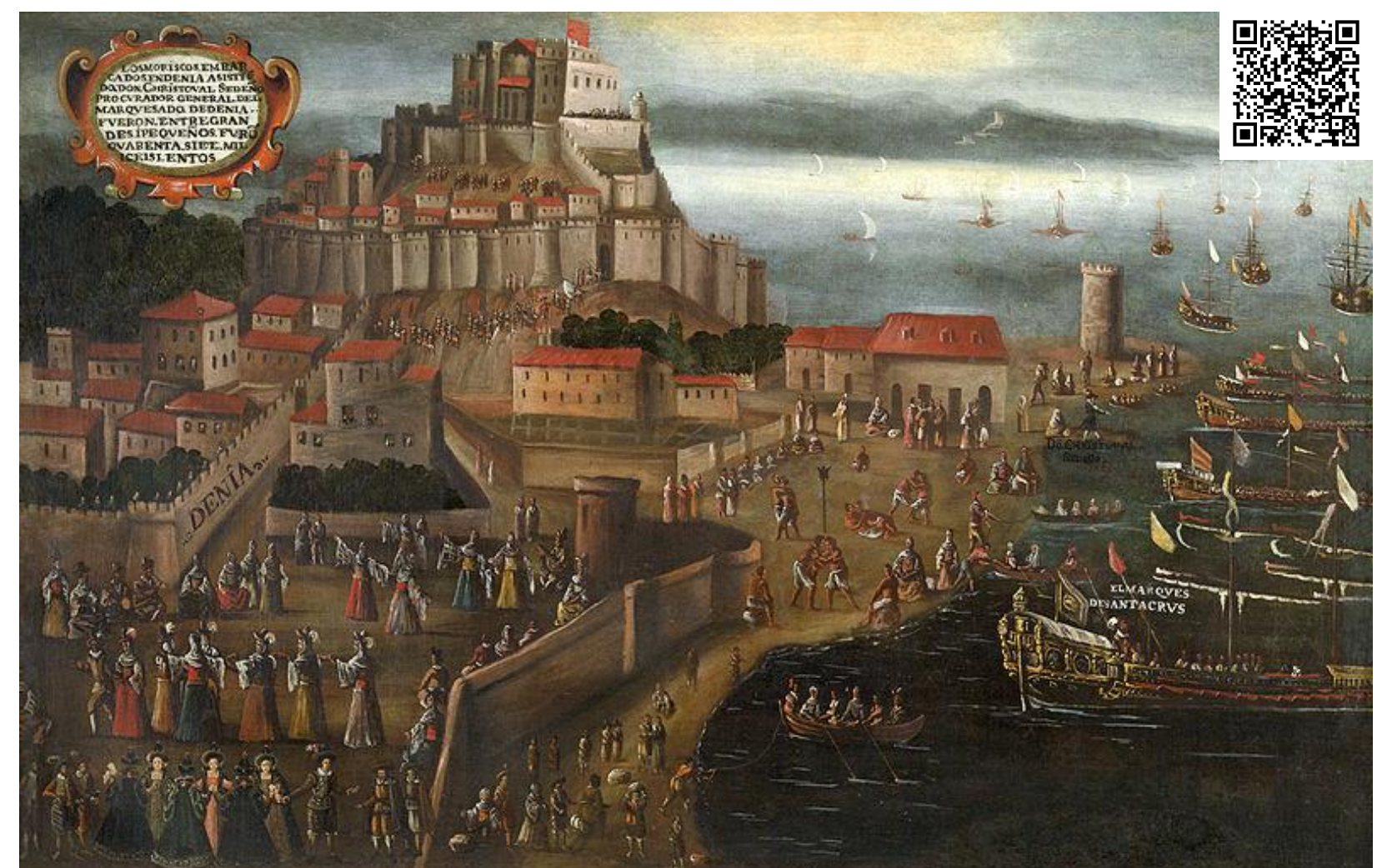
Cuadro que representa la expulsión de los moriscos en las costas de Denia