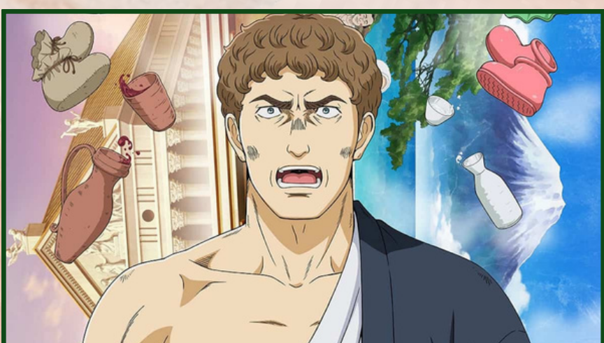
Serie animada: "Thermae Romae Novae" Ambientada en la antigua Roma