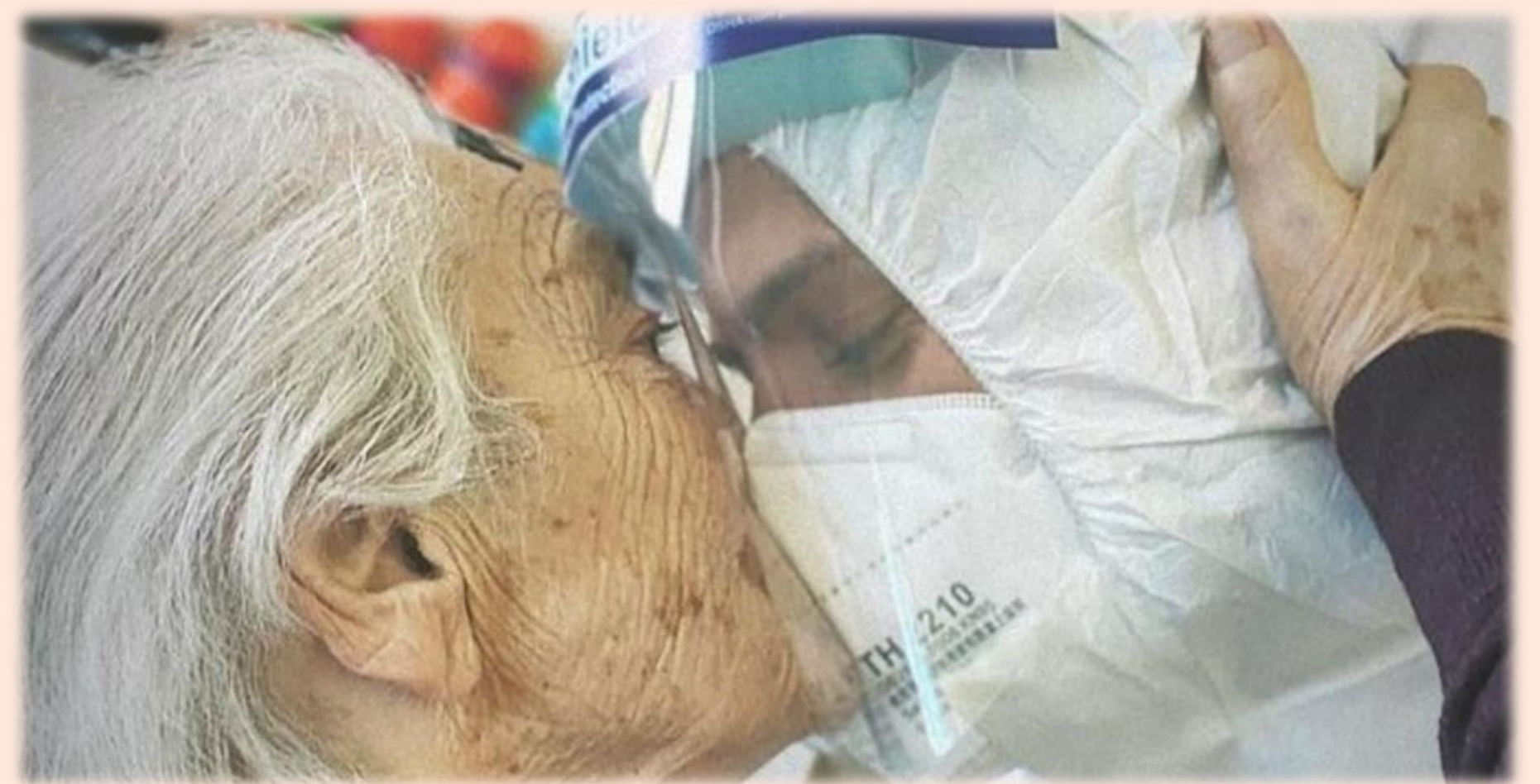
Agradecimiento de una anciana a uno de los profesionales sanitarios que cuidan de ella en una residencia de mayores de Manduria, Italia.