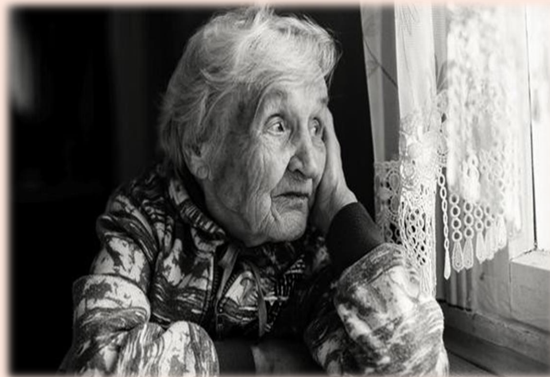
Anciana confinada durante la pandemia.

Sacar a la luz la importancia de la salud mental, siempre en segundo plano, a través de uno de los grupos más afectados en esta pandemia, los ancianos.