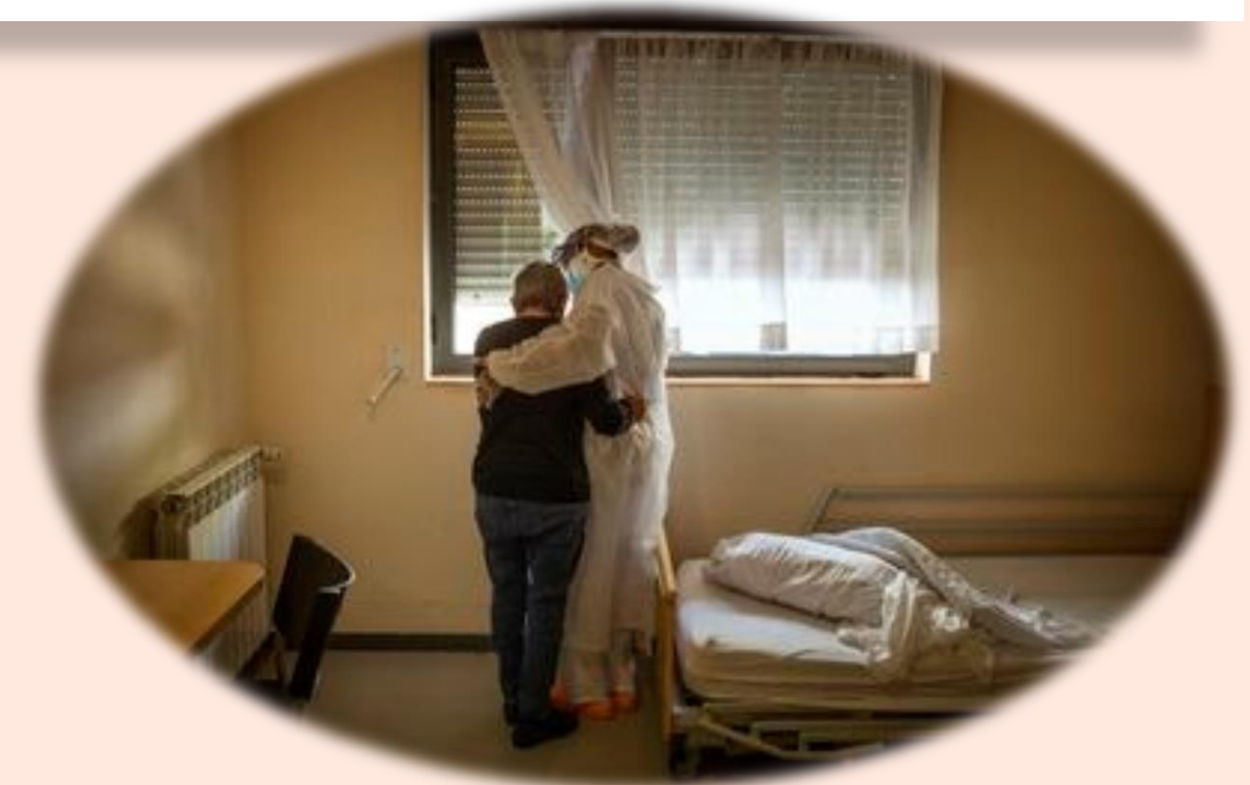
En una residencia de mayores.